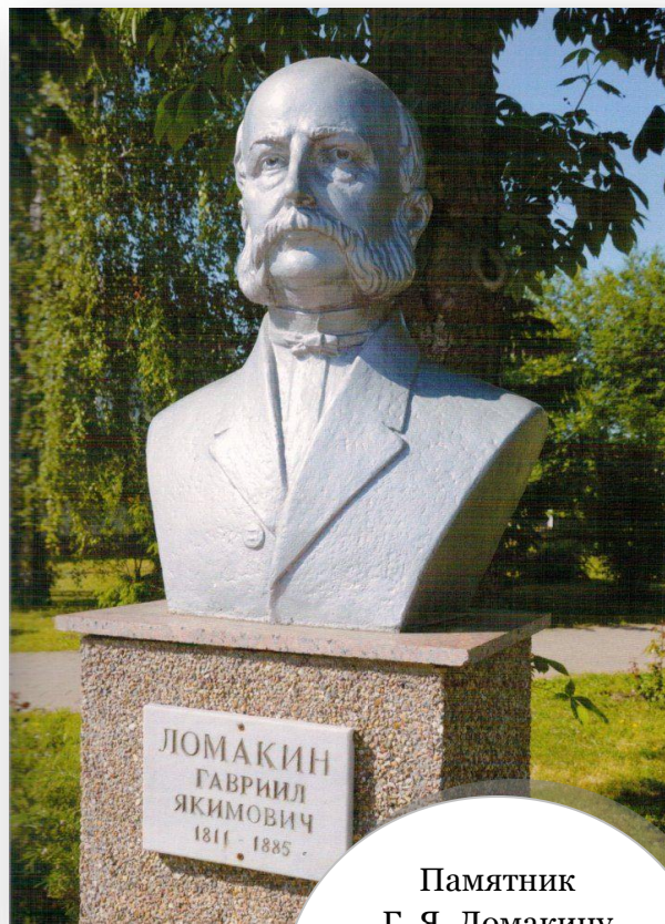
Памятник Г. Я. Ломакину на Аллее знаменитых земляков, ПГТ Борисовка